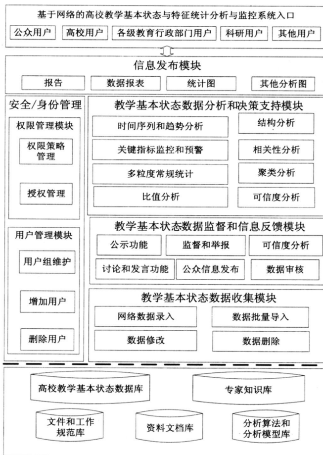
图2 教学基本状态数据库原型系统的功能架构框图